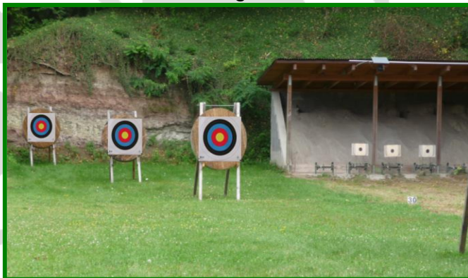
55 m Bogenstand