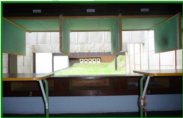
25 m Stand