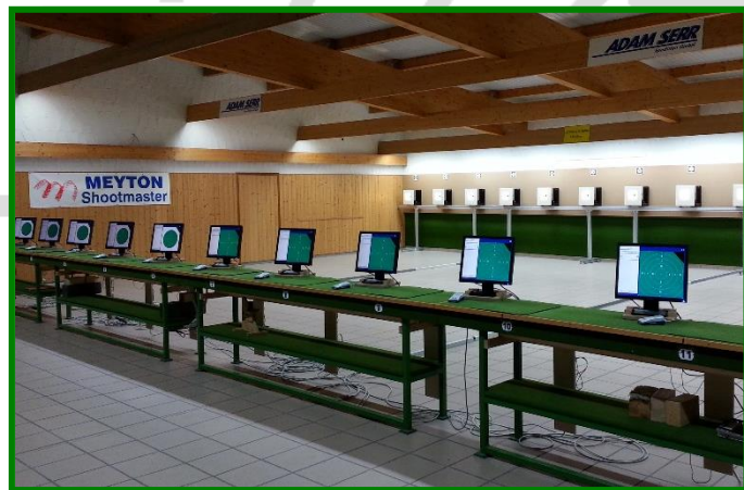
10 m Stand